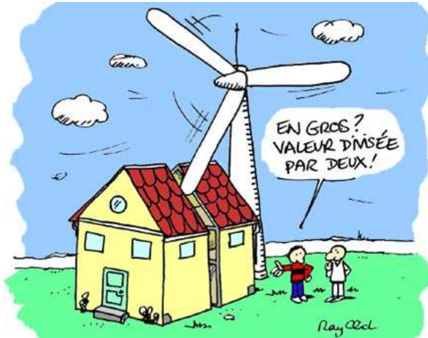
Eole et des bas Dessin de Ray Clid

Incinérateurs pas d'informations, éoliennes un peu de documentation, et antennes-relais alors ? Idem, ça reste très flou. On voit néanmoins passer sur le net des chutes de 20 à 30% des biens, même si les témoignages trouvés valent ce qu'ils valent.