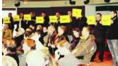
Les anti-éoliens ont brandi leurs slogans en fin de réunion