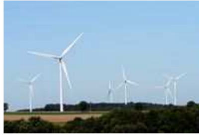
Photo : Parc éolien du pays de Saint-Seine (Côte-d'Or)

Louées pour leurs qualités environnementales, les éoliennes ont le vent en poupe. Mais plusieurs riverains se plaignent des effets du bruit et des vibrations engendrés par ces machines. Doctissimo s'est penché sur les impacts allégués de ces immenses aérogénérateurs sur notre santé, afin de démêler le vrai du faux.