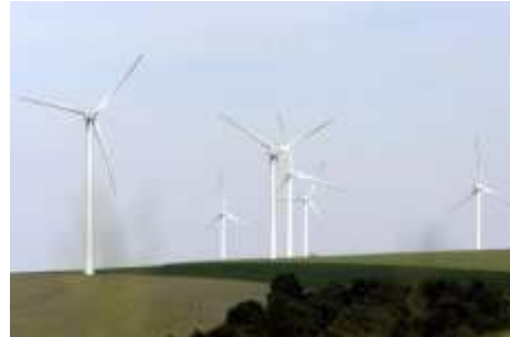
Trois zones de développement éolien étaient dans le collimateur de l'association.